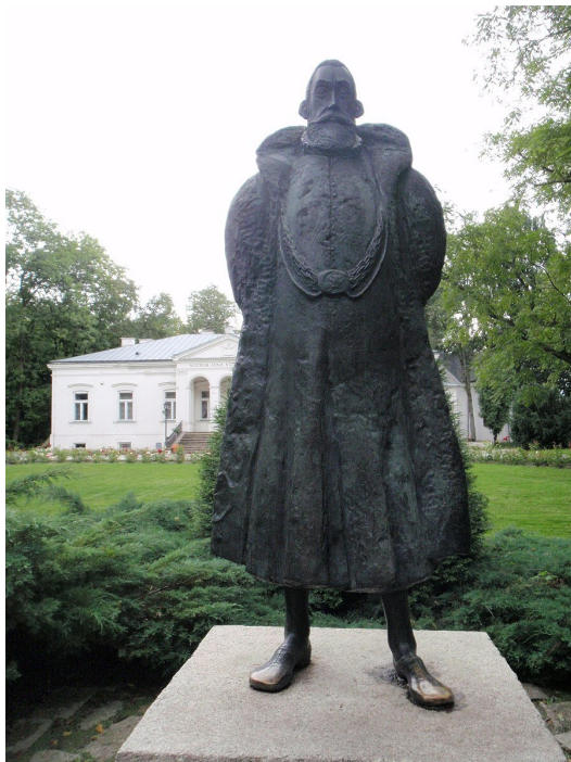
Pomnik Jana Kochanowskiego w Czarnolesie