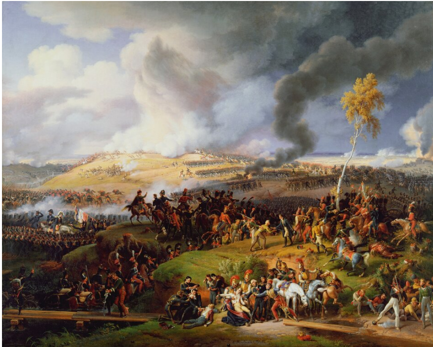
Louis Lejeune, Bitwa pod Borodino , 1812

poważnie ranny w kolano, ale mimo obrażeń nie opuścił pola bitwy i dowodził artylerią. Po amputacji nogi poruszał się o kuli.