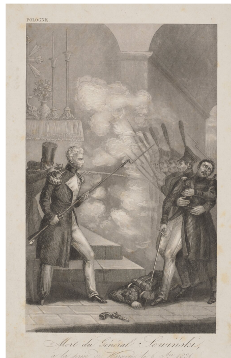
Znany wśród emigracji staloryt Śmierć gen. Józefa Sowińskiego

Szturm wojsk rosyjskich na tę część Warszawy odbył się 6 września. Z powodu dużej przewagi liczebnej Rosjan kilkugodzinna obrona Woli zakończyła się niepowodzeniem, a jej dowódca – pięćdziesięcioletni generał Sowiński zginął. Okoliczności jego śmierci nie są dokładnie znane, ale najczęściej podaje się informacje o zabiciu Sowińskiego na posterunku bojowym, a nie w ukryciu kościoła na Woli. Druga relacja krążyła jednak wśród emigrantów, którzy po upadku powstania listopadowego musieli opuścić ziemię polskie. Do jej utrwalenia przyczynił się między innymi znany na emigracji staloryt, na którym widać generała Sowińskiego stojącego z bagnetem u stóp ołtarza w kościele na Woli oraz sześciu nacierających na niego żołnierzy rosyjskich. Pisano wówczas, że: