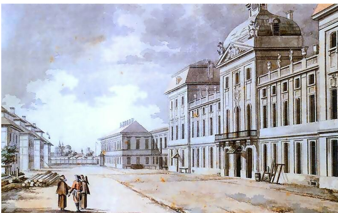
Zygmunt Vogel, akwarela przedstawiająca Szkołę Rycerską, 1785

Bohaterem lirycznym wiersza Juliusza Słowackiego [„ W starym kościółku na Woli... ”], który znany jest również pod tytułem Sowiński w okopach Woli , został generał Józef Longin Sowiński (1777–1831). W jego biografii najważniejsze są wydarzenia związane z losem żołnierza – absolwenta Akademii Szlacheckiego Korpusu Jego Królewskiej Mości i Rzeczypospolitej, czyli Szkoły Rycerskiej .