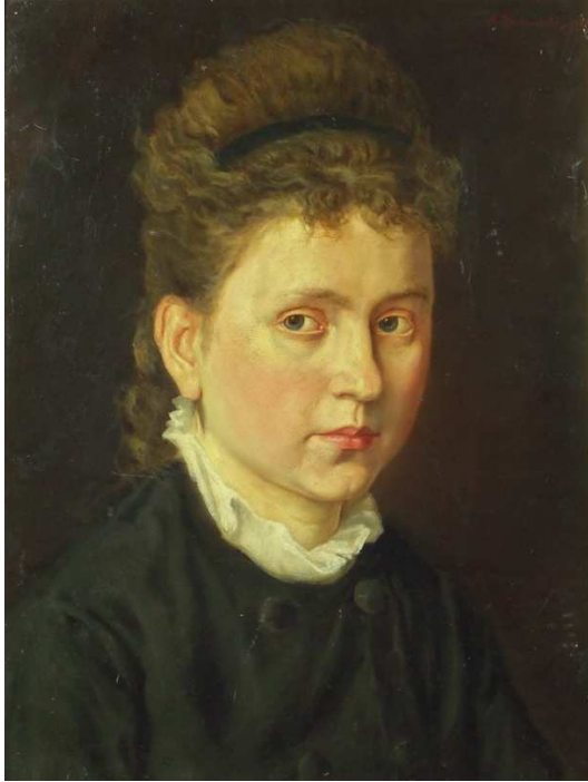
Kazimierz Pochwalski, Portret Elizy Orzeszkowej , 1879