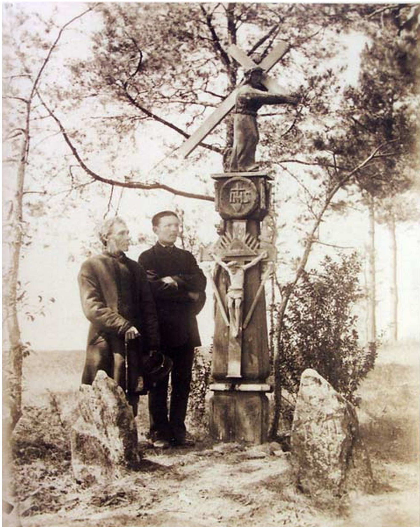
„Jasna legenda” – o powstaniu styczniowym w Nad Niemnem Elizy Orzeszkowej