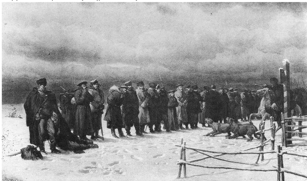
Artur Grottger, Pochód na Sybir , 1867

Źródło: Adam Mickiewicz, Dziady. Część trzecia , dostępny w internecie: https://wolnelektury.pl/katalog/lektura/dziady-dziady-poema-dziady-czesc-iii/ [dostęp 31.01.2021].