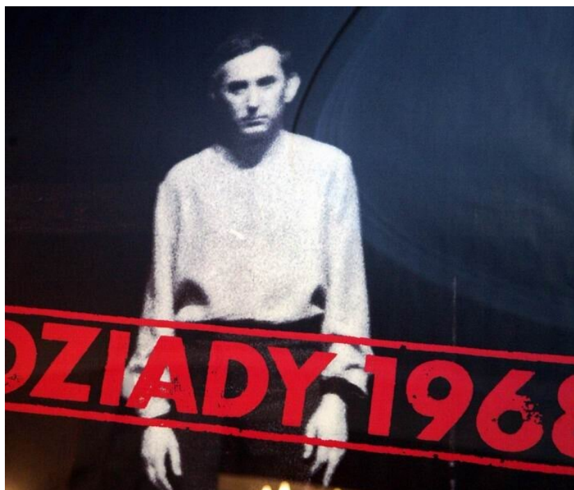
Gustaw Holoubek jako Konrad w Dziadach w reżyserii Kazimierza Dejmka, 1968

Właśnie w obronie osób relegowanych z uczelni 8 marca odbył się protest, który został brutalnie stłumiony. Zajścia te wywołały lawinę wydarzeń, które w historii określane są jako Marzec '68.