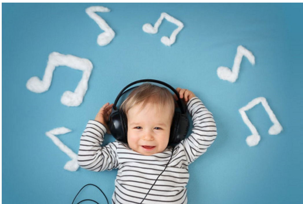
Muzyka od najmłodszych lat