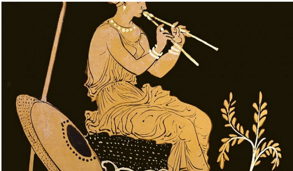
Aulos, teleradiosciacca.it, CC BY 3.0

Rozważania na temat tonacji i ich właściwości odnaleźć można w Państwie . Wskazuje tam Platon na dwie tonacje, które miały znaleźć zastosowanie w wychowaniu człowieka: dorycką i frygijską. O ile sięgnięcie po pierwszą z nich nie budzi wątpliwości, to wskazanie na tonację frygijską, niebędącą rodzimą tonacją grecką, jest w pewnym sensie niezrozumiałe, biorąc pod uwagę fakt, że Platon z tej przyczyny odrzucał aulos. Tonacja dorycka miała kształtować męstwo, zaś frygijska zrównoważenie. Tak jak odpowiednia muzyka właściwie kształtuje człowieka, tak nieodpowiednia może przynieść złe skutki w procesie wychowania człowieka. Tonacje, które Platon zdecydowanie odrzucał, to miksolidyjska i syntonolidyjska, które określał jako „płaczliwe”, a także jońska i lidyjska, które wg niego są „miękkie i pijackie”. Przestrzega również przed niewłaściwym łączeniem słów z melodiami i rytmem oraz komponowaniem utworów nieposiadających wartości mimetycznych – czysto instrumentalnych oraz czysto deklamacyjnych.