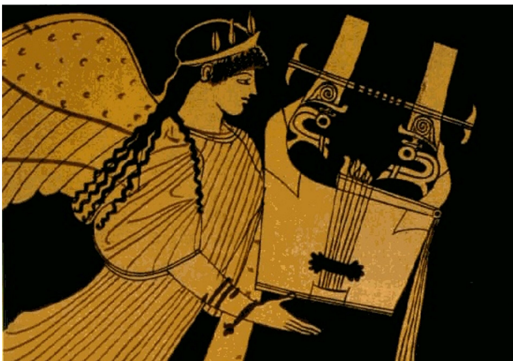
Kitara

Istotne miejsce dla muzyki wyznaczył Platon, kreśląc wizję swego państwa idealnego. Przewidywał dla niej wiele znaczących funkcji, wśród nich wychowanie obywateli oraz pomoc w ich edukowaniu w zakresie prawa. Platon stał na stanowisku, że muzyka ma właściwości mimetyczne i potrafi naśladować właściwe postawy i zachowania człowieka, stąd obcowanie z właściwą muzyką może takie postawy i zachowania u obywateli wykształcić. Przystąpił zatem do wyszczególnienia cech jakie powinna posiadać wartościowa dla społeczeństwa muzyka ( teoria mimesis ). Jego rozważania dotyczą m. in. wyboru instrumentów oraz tonacji, których stosowanie może prowadzić do wskazanego celu. Spośród instrumentów na pierwszym miejscu stawia strunowe instrumenty rodzime: kitarę i lirę, które związane były z kultem Apollina, odrzucając jednocześnie pochodzący z Frygii instrument dęty aulos. Taki wybór podyktowany był nie tylko właściwościami brzmieniowymi tych instrumentów, lecz także dążeniem Platona do odsunięcia obcych tonacji, takich jak frygijska, czy lidyjska, na rzecz preferowanej tonacji doryckiej.