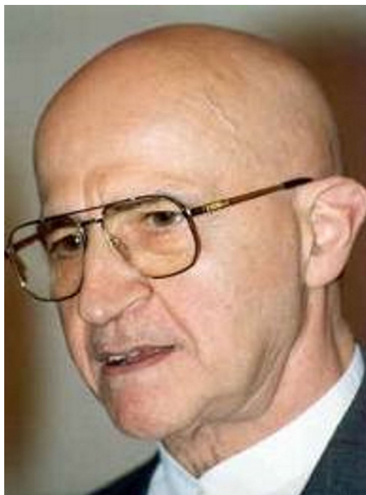
Alferd Tomatis, soundwellness.com , CC BY 3.0

nienarodzonych, stąd bardzo ważne jest zwrócenie uwagi na dźwięki, którymi są otaczane.