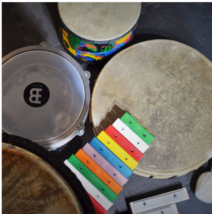
Instrumenty wykorzystywane w muzykoterapii

Pierwszy w Polsce Zakład Muzykoterapii powstał w 1972 r. na Wydziale Kompozycji i Teorii Muzyki Państwowej Wyższej Szkoły Muzycznej we Wrocławiu (obecnie Akademia Muzyczna).