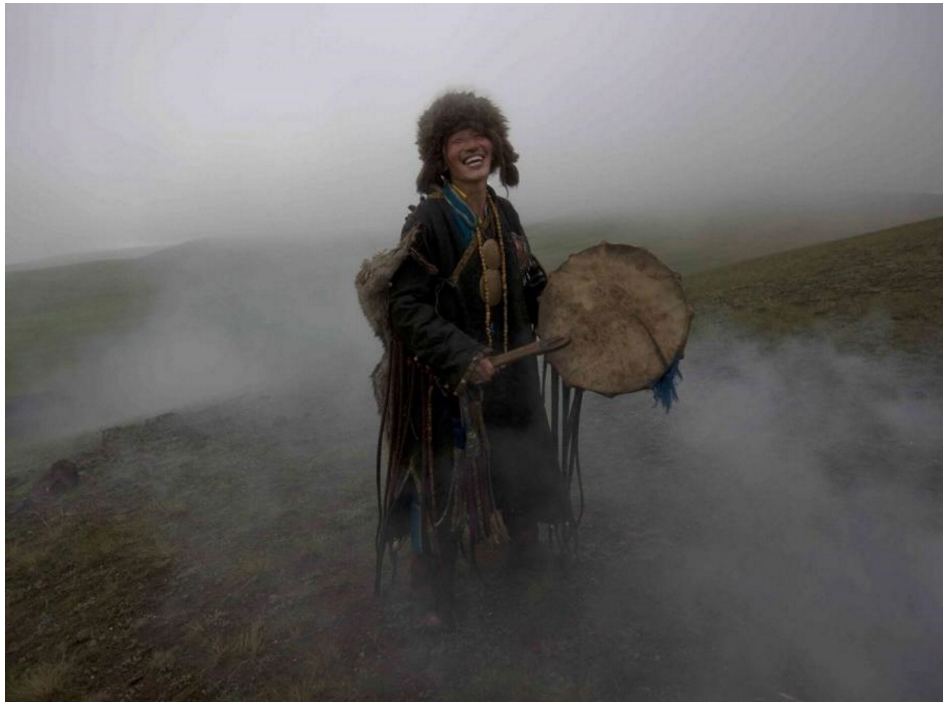
Szaman z Mongolii