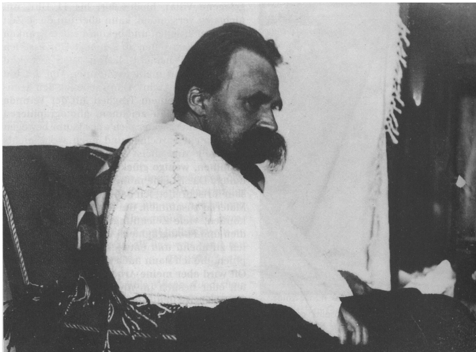
Friedrich Nietzsche, fotografia z 1899 roku.