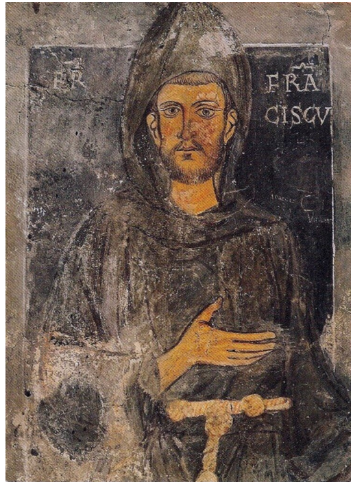
Najstarsze przedstawienie świętego Franciszka z Sacro Speco w Subiaco (XIII wiek)

Nie bez powodu zawołaniem zakonu franciszkanów jest zdanie: Pax et bonum (łac.), czyli pokój i dobro. Święty Franciszek, żyjący na przełomie XII i XIII wieku, stworzył wizję wiary radosnej, w której najważniejszym czynnikiem była miłość zarówno do ludzi, jak i zwierząt. Święty uważał, że miłość do Boga objawia się w miłości do jego stworzeń. Głosił więc powszechny pokój, braterstwo i szerzenie dobra, sądząc, że jest to miara naszego człowieczeństwa. Miłość miała wyrażać się nie tylko w stosunku do innych ludzi, szczególnie chorych i cierpiących, którym należało udzielać pomocy, ale także do własnego ciała. Franciszek postulował, by go nie umęczać i nie stosować praktyk ascetycznych. Odrzucał wszelkie okrucieństwo człowieka wobec siebie, gdyż Bóg stworzył go na swoje podobieństwo i z miłością, która wyklucza pogardę dla własnej cielesności.