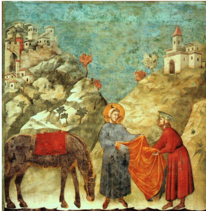
Jeden z fresków Giotto di Bondone [czytaj: dziotto di bondone](popularnie nazywanego Giotto) w bazylice św. Franciszka w Asyżu - Franciszek oddaje płaszcz ubogiemu

Wszyscy inni pograżyli się w smutku, a tylko on jeden był wesoły. Gdy go współwięźniowie za to ganili, rzekł do nich: „Wiedźcie, że dlatego raduję się, iż stanę się świętym i cały świat modlić się będzie do mnie!”