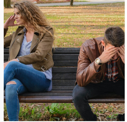
Przyczyny i skutki konfliktów społecznych