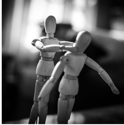
Rozstrzygnięcie konfliktów z użyciem siły