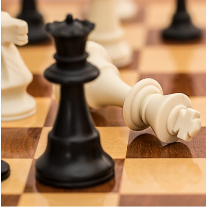
Teorie konfliktów społecznych