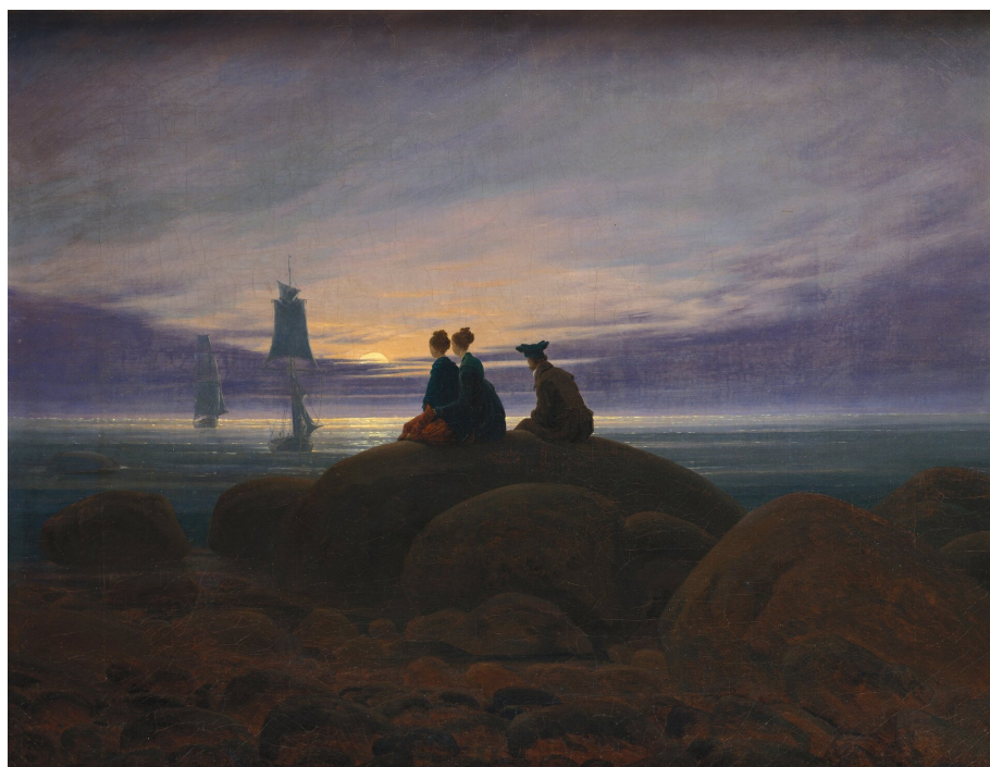
Caspar David Friedrich, Światło księżyca na spokojnym morzu , 1822

Komentatorzy zwracają uwagę, że w postaci Kordiana Słowacki sportretował siebie. W losach bohatera można odnaleźć elementy biografii autora. Nadużyciem byłoby utożsamianie postaci literackiej z poetą, jednak perspektywa biograficzna pozwala na odczytanie dzieła jako rozrachunku romantyka z samym sobą i własną epoką. Kordian ukazany jest jako człowiek chory emocjonalnie, niezdolny do działania, „zatruty” literaturą. Stworzenie tej postaci było dla Słowackiego swego rodzaju autoterapią. W osobie bohatera poeta przedstawił zarówno słabość własnej psychiki, jak i stan ducha całego pokolenia.