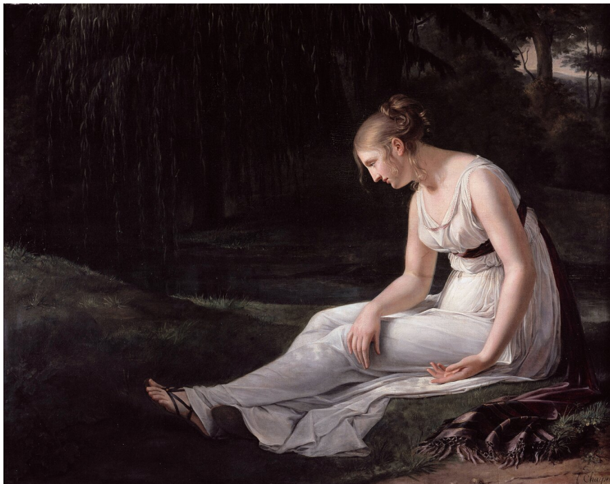
Constance Marie Charpentier, Melancholia , 1801