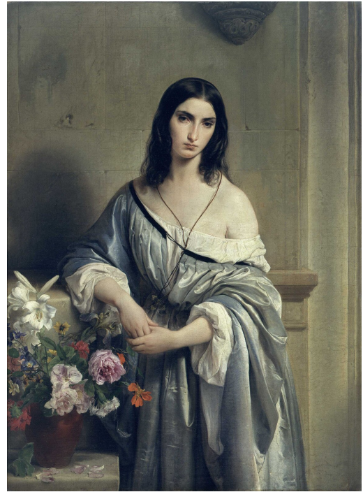
Francesco Hayez, Melancholia, 1840–1842

W Kordianie Juliusza Słowackiego została przedstawiona biografia romantycznego młodzieńca. Czytelnik poznaje tytułowego bohatera w I akcie dramatu. Kordian ma wtedy piętnaście lat. Doświadcza wówczas lęku przed życiem, melancholii, zniechęcenia, nudy. Czuje się samotny, nierozumiany. Nie znajduje uspokojenia ani w opowieściach swojego sługi Grzegorza, ani w miłości. Nieustannie ucieka – podejmuje próbę samobójczą, udaje się w dalekie podróże. W działaniach kieruje się głównie emocjami, stąd jego niespotykane imię, wywodzące się od łacińskiego słowa cor , czyli serce. Kordian jest przykładem bohatera romantycznego bliższego tradycji zachodnioeuropejskiej (angielskiej, francuskiej czy niemieckiej) niż polskiej, Mickiewiczowskiej. Gustaw z IV części Dziadów Mickiewicza cierpi z powodu odrzuconej miłości; Kordian, dotknięty „chorobą wieku”, przeżywa ustawiczny niepokój, który nie ma wyraźnej, konkretnej przyczyny. Stan bohatera wynika z aury czasu – młody człowiek nie widzi przed sobą perspektyw, boi się przyszłości, gdyż wydaje mu się ona niepewna, a on sam czuje się niespełniony. Jego wyobrażenia syci się romantycznymi wizjami literackimi. Kształtują one uczucia, ale nie tworzą spójnego i dającego poczucie bezpieczeństwa obrazu świata.