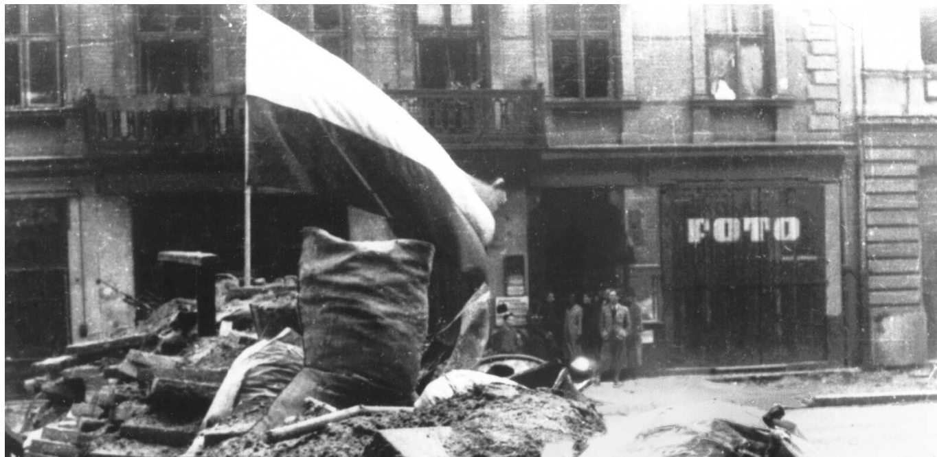
Flaga na barykadach podczas Powstania Warszawskiego