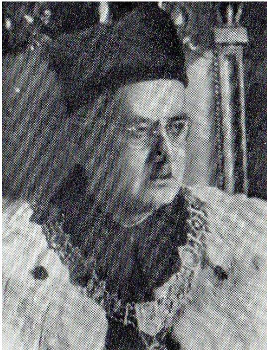
Kazimierz Ajdukiewicz (1890 - 1963 r.)

Ajdukiewicz był profesorem Uniwersytetu Jana Kazimierza, Uniwersytetu im. Adama Mickiewicza i Uniwersytetu Warszawskiego, a także członkiem Polskiej Akademii Nauk oraz Polskiej Akademii Umiejętności.