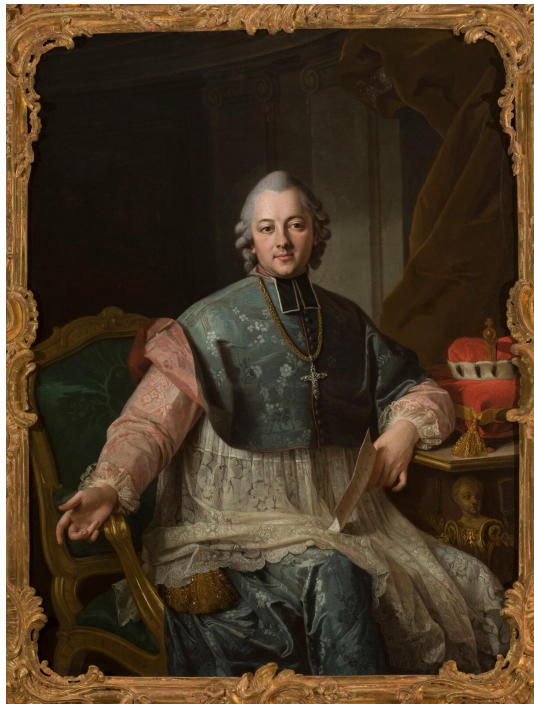
Per Krafft (Starszy), Ignacy Krasicki , 1767

We fragmencie Monachomachii zostały wykorzystane i poddane żartobliwemu przekształceniu wszystkie zabiegi językowe, zastosowane we wzorcu, którym jest hymn . Oba utwory mają identyczną konstrukcję stylistyczną – wywód prowadzący do puenty o charakterze sentencji, kunsztowny tok składniowy, zbliżony tok argumentacji.