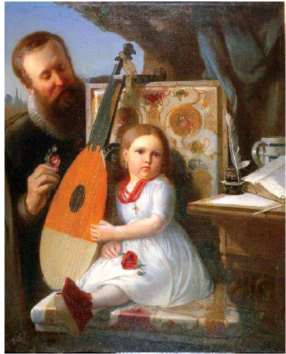
Władysław Łuszczkiewicz, Jan Kochanowski z Urszulką, przed 1900

Tren XI jest rozrachunkiem z dotychczasowymi przekonaniem, wiarą w sens i ład życia. Dzieje się tak z powodu osobistego nieszczęścia. Pod wpływem cierpienia poddany krytyce zostaje dotychczasowy system wartości, charakterystyczny dla epoki renesansu (zanegowanie cnoty, stoickiego spokoju, rozumu, wiary w Bożą opatrzność nad światem). Rodzą się liczne pytania egzystencjalne. Człowiek uświadamia sobie kruchość życia, brak wpływu na koleje losu, nieprzewidywalność zdarzeń. Śmierć dziecka jest najcięższym doświadczeniem życiowym, przeżycie go prowadzi do obalenia dotychczasowego systemu filozoficznego oraz wyznawanej wiary.