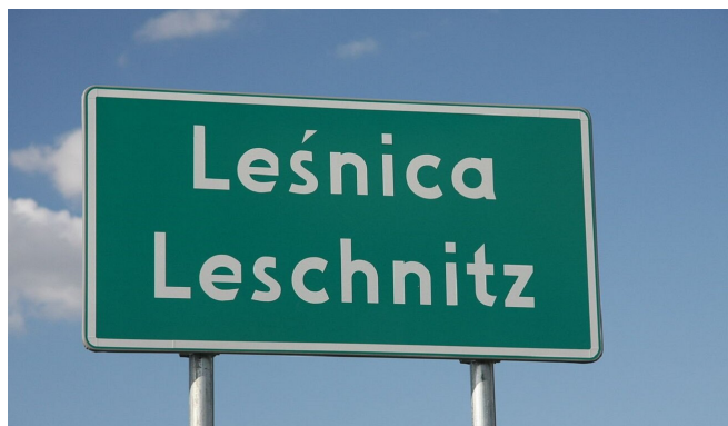
Dwujęzyczna tablica z nazwą przed wjazdem do Leśnicy.