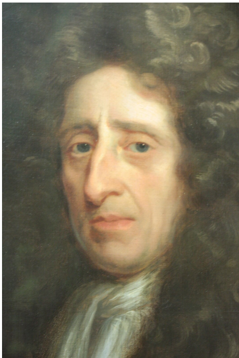
Godfrey Kneller, portret Johna Locke'a