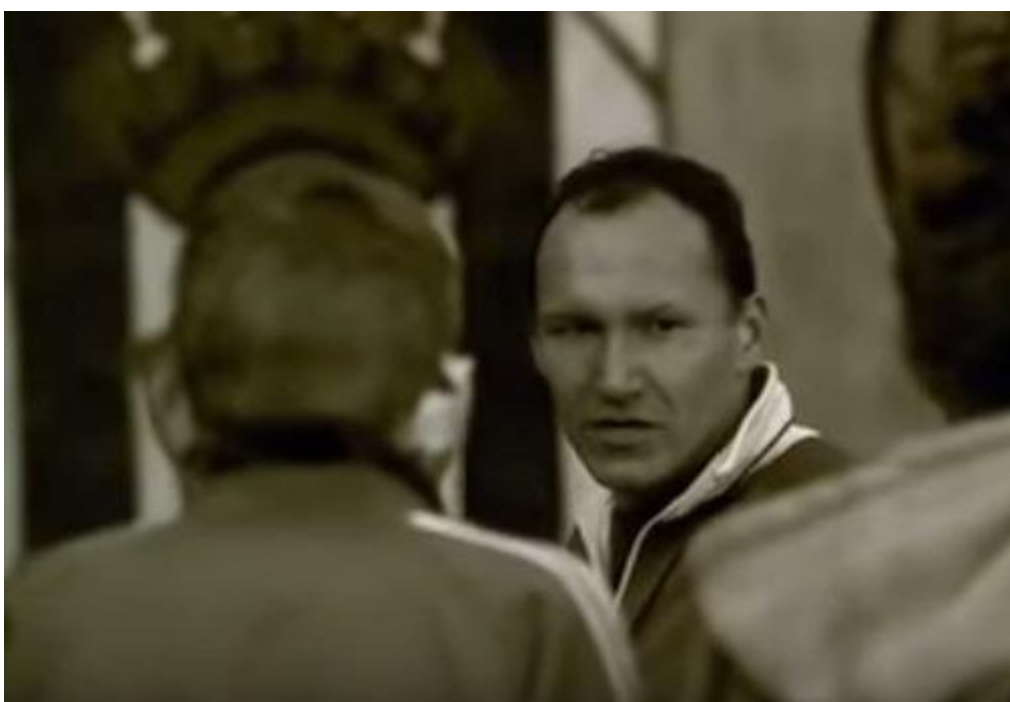
Kadr z filmu Męska sprawa , reż. S. Fabicki. Tylko do użytku edukacyjnego