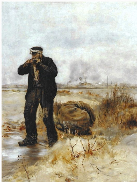
Jean-Francois Raffaelli, Handlarz starymi szmatami zapalający fajkę , przed 1924

W sztuce pojęcie naturalizmu wiąże się z wiernym naśladownictwem natury, dążeniem do obiektywizmu w przedstawianiu ciemnej strony rzeczywistości – ludzkiej nędzy, krzywdy, słabości człowieka, zagrożenia, brzydoty. W dziełach naturalistycznych dominuje zamknięta kompozycja, zachowanie perspektywy oraz wyrazista forma.