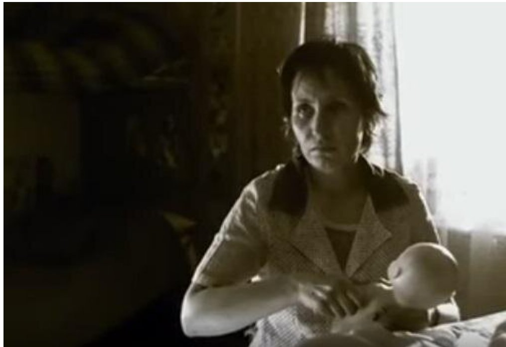
Kadr z filmu Męska sprawa , reż. S. Fabicki. Tylko do użytku edukacyjnego