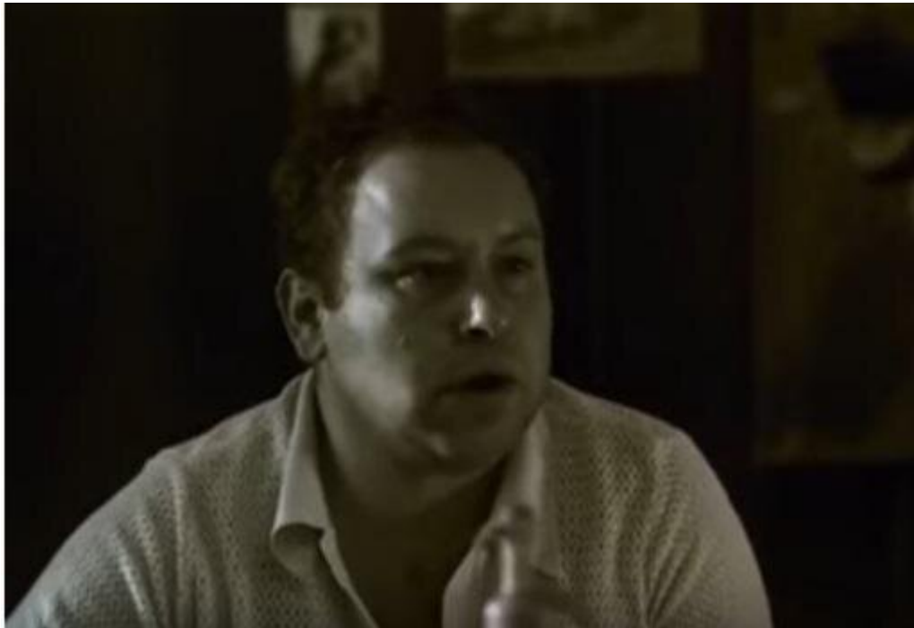
Kadr z filmu Męska sprawa , reż. S. Fabicki. Tylko do użytku edukacyjnego

W filmie Sławomira Fabickiego przemoc ma różny wymiar. Obejrzyj poniższe kadry, przypomnij sobie fabułę i określ, o jaką przemoc chodzi.