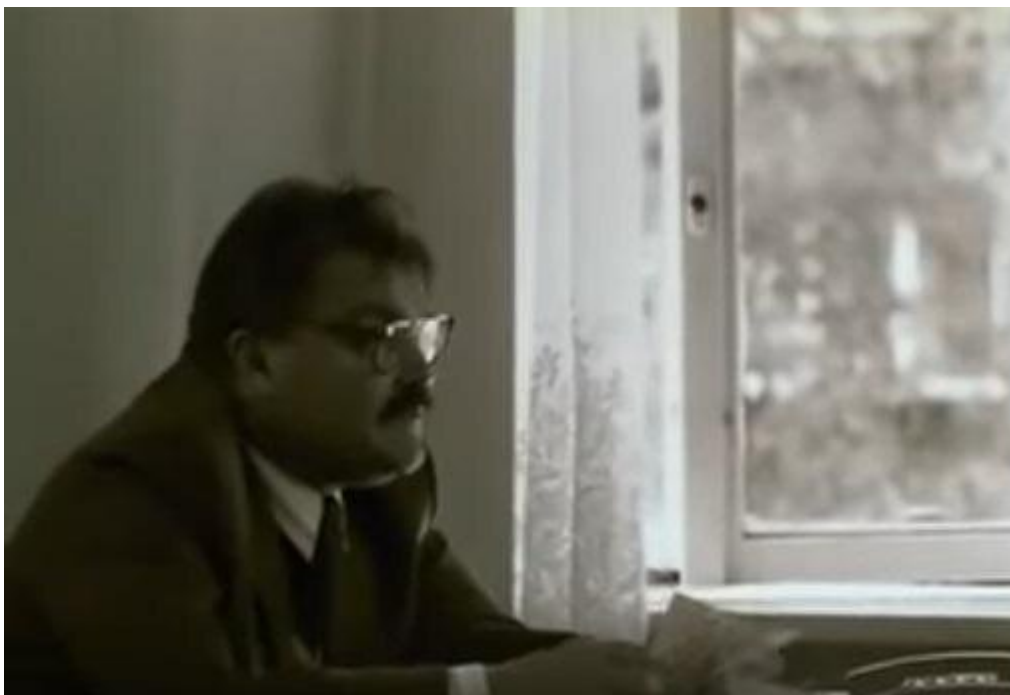
Kadr z filmu Męska sprawa , reż. S. Fabicki. Tylko do użytku edukacyjnego