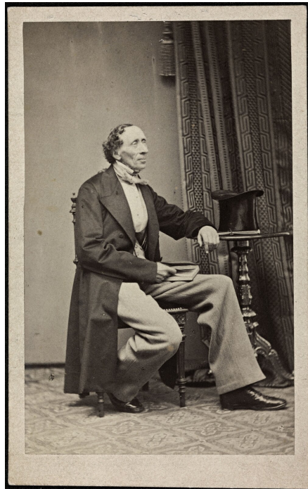
Fotografia Hansa Christiana Andersena