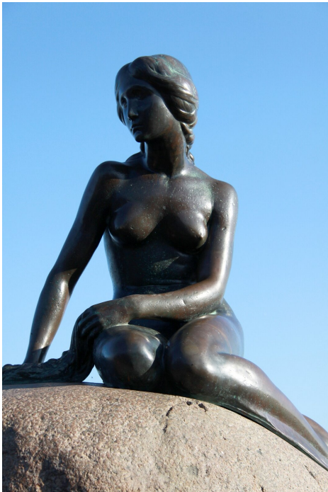
Mała Syrenka, Kopenhaga

Źródło: Autor posągu: Edvard Eriksen (1876-1959), autor zdjęcia: Avda-berlin, domena publiczna.