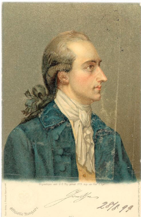
Georg Oswald May, Goethe w 1779 roku , 1899.