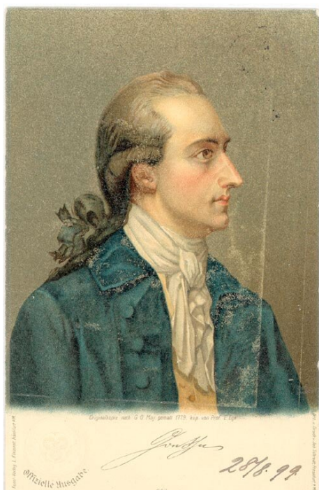
Georg Oswald May, Goethe w 1779 roku , 1899.