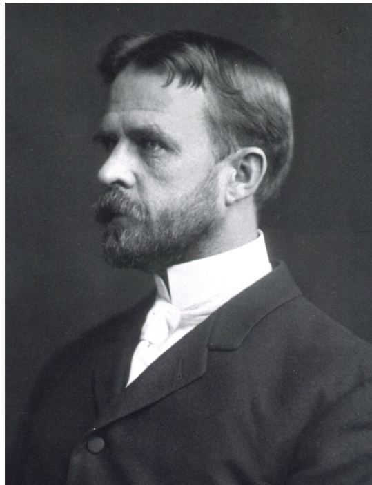
Thomas Hunt Morgan (1866–1945).

W 1933 r. Thomas Hunt Morgan, amerykański genetyk, otrzymał Nagrodę Nobla za odkrycia dotyczące roli chromosomów w przekazywaniu cech dziedzicznych.