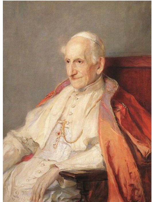
Leon XIII – włoski duchowny rzymskokatolicki, arcybiskup Perugii w latach 1846–1877, kamerling Świętego Kościoła Rzymskiego w latach 1877–1878, 256. papież w okresie od 20 lutego 1878 do 20 lipca 1903; uznawany jest za pierwszego nowoczesnego papieża, który starał się nawiązać kontakt ze współczesnym światem; po ogłoszeniu encykliki Rerum Novarum nazywany „papieżem robotników”.

Leon XIII oparł swoją doktrynę na neotomizmie . Interpretował filozofię św. Tomasza z Akwinu, akcentując problematykę jednostki ludzkiej. Stała się ona podstawą tzw. personalizmu chrześcijańskiego. Leon XIII nie akceptował obu najważniejszych i w największym stopniu kształtujących sposób myślenia w XIX wieku doktryn politycznych, czyli liberalizmu i socjalizmu. Doszedł jednak do wniosku, że przemian społecznych nie da się odwrócić. Uznał, że burżuazja pokonała ostatecznie feudałów, że nie ma powrotu do średniowiecznego modelu współpracy i współrzędzenia arystokracji i Kościoła. Zauważył również, że liczebny wzrost proletariatu stawia przed Kościołem nowe wyzwania, dla których trzeba znaleźć nowe rozwiązania. Nie było to łatwe dla przedstawicieli Kościoła i dla samego papieża, ale uznał on konieczność pogodzenia się ze zmianami społecznymi. Postanowił zaproponować nowe rozwiązania, które mogłyby zaspokoić potrzeby robotników, równocześnie odciągając ich od poparcia dla socjalistów, którzy propagowali m.in. ateizm jako jedną z form sprzeciwu wobec idei sojuszu państwa i Kościoła. Dlatego w swoich encyklikach, stanowiących podstawę nauki społecznej Kościoła, zaaprobował niektóre rozwiązania liberalizmu. Zaakceptował system parlamentarny, tolerancję religijną i uznał socjalistyczną tezę o istnieniu wielkiego zróżnicowania społeczeństwa w kapitalizmie.