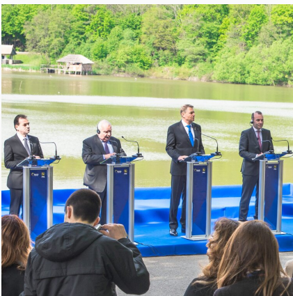
Chrześcijańska demokracja -