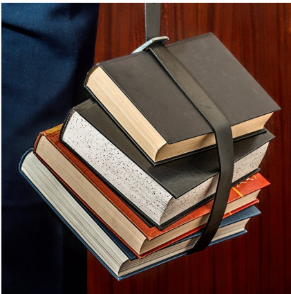
Konserwatyzm i katolicka nauka społeczna