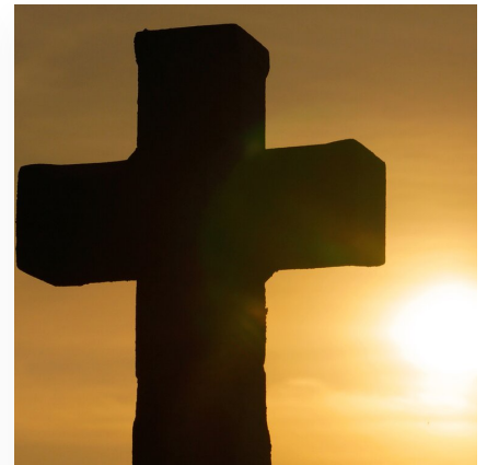
Chrześcijańska demokracja - przykład