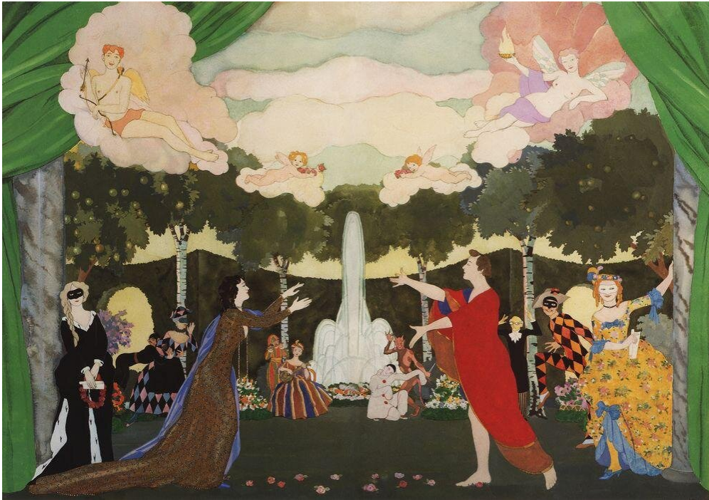
Konstantin Somov, Szkic kurtyny dla moskiewskiego teatru, 1913

Część oceniająca ma za zadanie wskazać opinie dotyczące poszczególnych aspektów omawianego dzieła. Dotyczy ona zazwyczaj tych samych zjawisk (w przypadku spektaklu, np. ocena scenografii czy gry aktorskiej), niemniej jednak zawiera element wartościujący – przedstawienie wad i zalet.