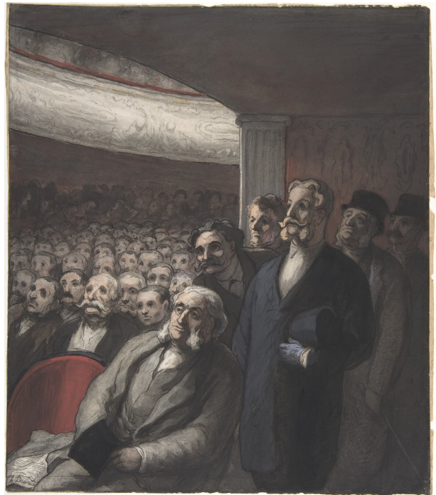
Honoré Daumier, Widownia teatru , XIX wiek

Argumentacja w recenzji jest zawsze podporządkowana subiektywnej ocenie autora, choć nie powinna rządzić się zupełną dowolnością ocen i sądów, lecz uwzględniać obiektywną wiedzę na temat sztuki literackiej, filmowej czy teatralnej. Wzorcowy autor recenzji jest więc rozważny i dobrze poinformowany na temat dzieła, które ocenia, jak również ma odwagę przekazywać osobiste sądy, nawet niepopularne czy kontrowersyjne. Struktura recenzji zależy od rodzaju omawianego dzieła – inaczej będzie wyglądać recenzja najnowszego filmu animowanego, inaczej zaś publikacji naukowej – a także medium, w którym zostaje zaprezentowana (pismo fachowe a radio, telewizja itp.), odbiorcy, do którego jest kierowana, wreszcie indywidualnego stylu piszącego.