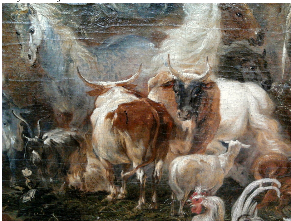
Michael Willmann, Stworzenie świata (fragment), 1668

Źródło: Aw58, dostępny w internecie: commons.wikimedia.org, licencja: CC BY-SA 3.0.