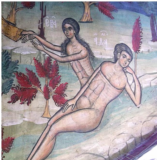
Fragment fresku Stworzenie Ewy , znajdującego się w monasterze w Suczawicy (Rumunia)

Sześć pierwszych części opisu stworzenia nieba, ziemi, ciał niebieskich i człowieka prowadzi do strofy siódmej.