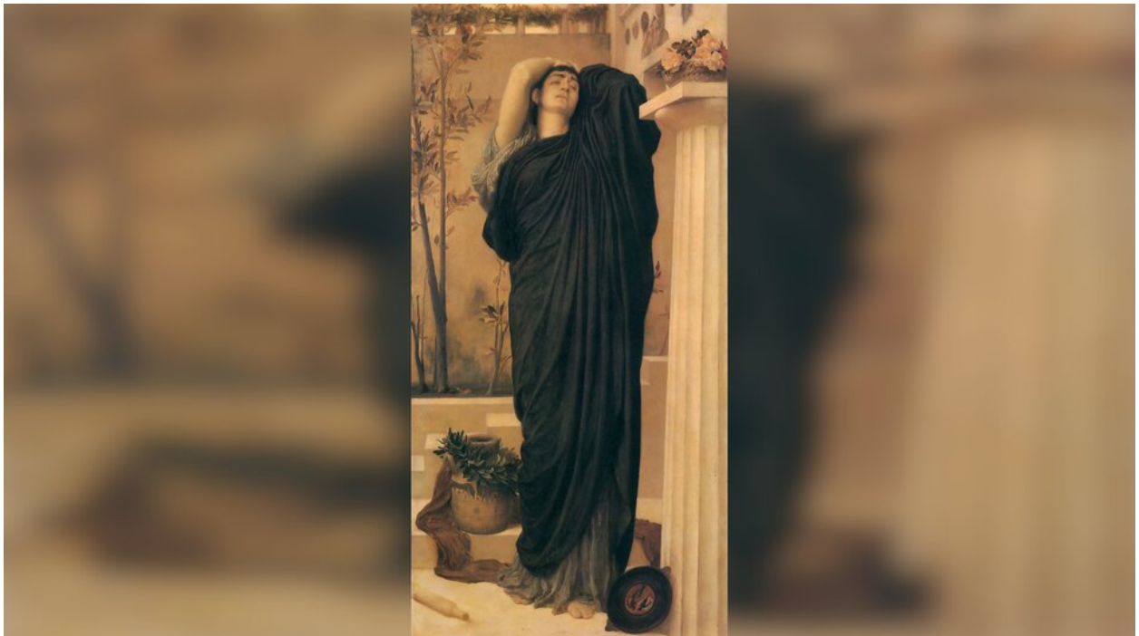
Frederic Leighton, Elektra przy grobie Agamemnona , 1868–1869

Grób Agamemnona to ósma pieśń poematu dygresyjnego Podróż do Ziemi Świętej z Neapolu , utworu poświęconego wędrowce na Wschód, którą Słowacki odbył w latach 1836–1837. Autor przywołuje w tej części poematu historię Ateńczyków i Spartan, by z jej perspektywy dokonać oceny polskiej rzeczywistości. Dlatego mniej informacji dotyczy dziejów antycznych narodów, a więcej przeżyć Polaka, dla którego odległe wydarzenia stają się pretekstem do przeprowadzenia narodowego rachunku sumienia.