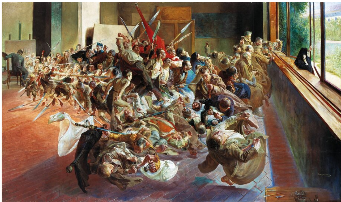
Jacek Malczewski, Melancholia , 1890–1894

Wybierz obraz Jacka Malczewskiego, który twoim zdaniem koresponduje z przesłaniem utworu Grób Agamemnona . Uzasadnij swój wybór, analizując obraz oraz przytaczając odpowiednie cytaty z wiersza.