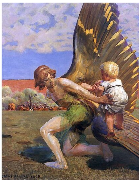
Jacek Malczewski, Do sławy , 1903