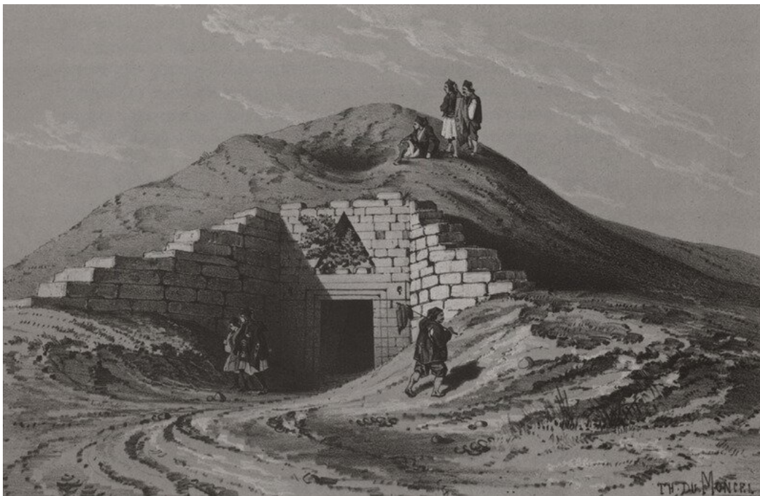
Théodore Du Moncel, Skarbiec Atreusza w Mykenach , w którym znajduje się także grób Agamemnona, 1843