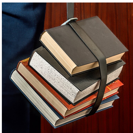
Międzynarodowe systemy współpracy i bezpieczeństwa. Organizacja Narodów Zjednoczonych (ONZ) cz. 2