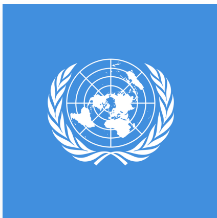
Powstanie i cele ONZ