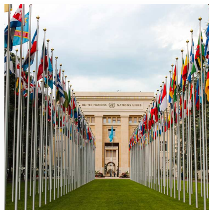
Agendy ONZ i obszar ich działalności