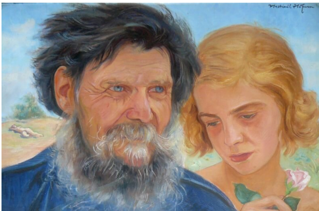
Młodość i starość

Źródło: Wlastimil Hofman, Młodość i starość , 1922, domena publiczna.