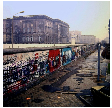
Przemiany w Polsce i na świecie po upadku komunizmu