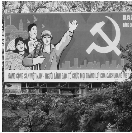
Komunizm – teoria i praktyka