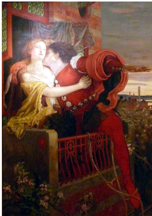
Ford Madox Brown Romeo i Julia