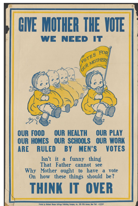
Plakat amerykańskich sufrażystek promujący prawa wyborcze dla kobiet

do określonego państwa cieszyła się ona wieloma przywilejami, ale i miała wiele