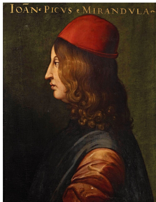
Cristofano dell'Altissimo, Pico della Mirandola , XV w.

Tekst Mirandoli, który był znany staropolskim poetom, ma szczególne znaczenie dla rozważanych przez nas kwestii: prawdopodobnie pod jego wpływem powstała Pieśń XIX Jana Kochanowskiego, znana jako Pieśń o dobrej sławie . Według włoskiego filozofa, uprzywilejowana pozycja człowieka polega na tym, że jest on mikrokosmosem odzwierciedlającym stworzony przez Boga wszechświat. Aniołowie, będąc jedynie istotami duchowymi, nie mogą stanowić wizerunku Boskiego dzieła, może nim być jedynie człowiek, który posiada zarówno pierwiastek duchowy – ma bowiem duszę, jak i – ze względu na swe ciało – pierwiastek zwierzęcy. Pico zwraca uwagę, że człowiek, będąc świadomym swego niezwykłego miejsca w kosmosie, przy pomocy duchowych zdolności może kształtować siebie i wpływać na własny los. Tak więc może stoczyć się do rzędu bydła, jak i wznieść do poziomu istot boskich. Jest twórcą i rzeźbiarzem własnego losu, bowiem, podobnie jak Bóg, posiada wolną wolę i rozum.