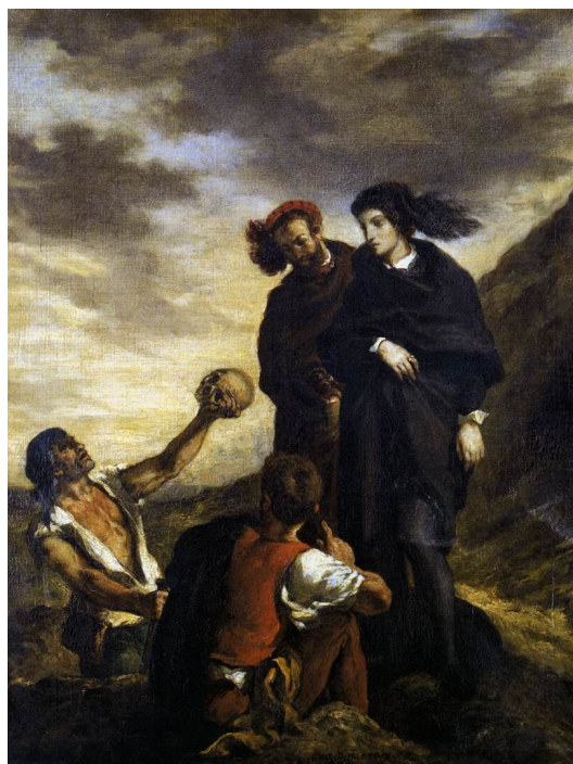
Eugène Delacroix, Hamlet i Horacja na cmentarzu , 1839

w dramatach to: dobry król — zły król; postać szlachetna — postać nikczemna; osoba rozważna — osoba porywcza; postać męska — postać żeńska.