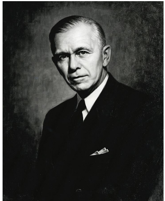
George C. Marshall – amerykański generał, sekretarz stanu USA od 21 stycznia 1947 do 20 stycznia 1949 r. W uznaniu zasług przy stworzeniu gospodarczego

W 1947 r. amerykański sekretarz stanu George C. Marshall przedstawił plan pomocy gospodarczej dla Europy. Plan Marshalla zakładał wspieranie odbudowy gospodarki europejskiej ze zniszczeń, a przez to możliwie maksymalne zmniejszenie skutków powojennego kryzysu. W ten sposób USA chciały zapobiec wykorzystaniu przez komunistów trudności gospodarczych (i wywołanego nimi niezadowolenia społecznego) do przejęcia władzy. Program zakładał również, że Stany Zjednoczone zachowają wpływ na sposób wydatkowania przekazanych środków, a beneficjenci będą zacieśniać międzynarodowe relacje gospodarcze i handlowe.