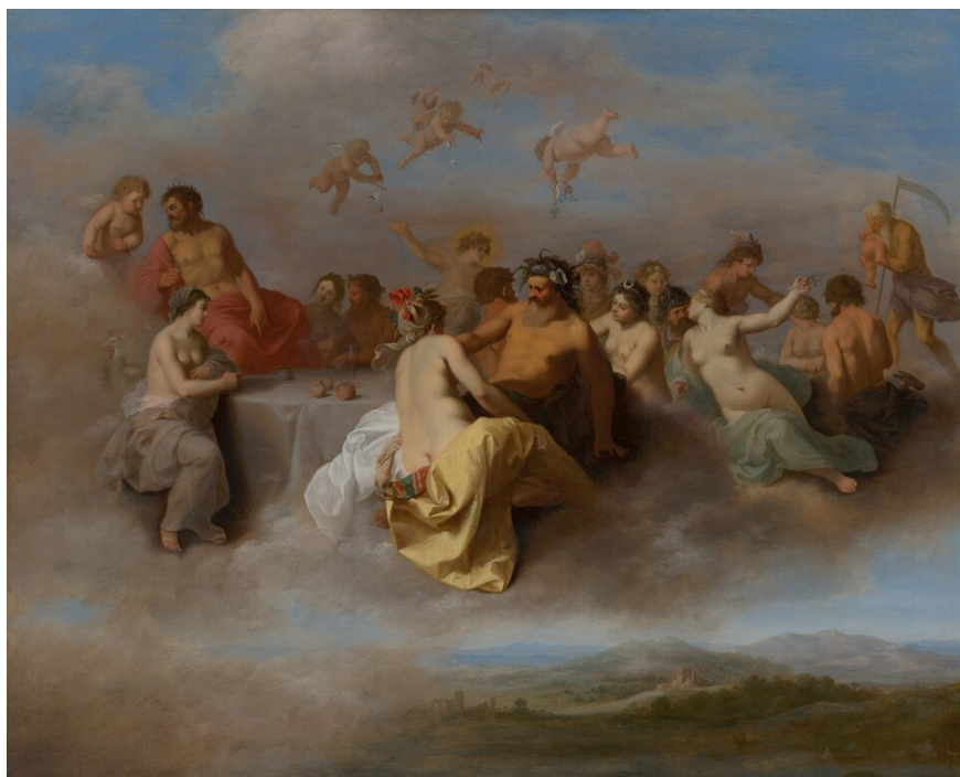
Cornelius van Poelenburgh, Rada bogów , ok. 1630

W klasycznej definicji psychologicznej mit jest zaś projekcją treści nieuświadomianych sobie przez człowieka i formą uzewnętrznienia pragnień tkwiących w danej jednostce, ale typowych dla ludzkości.