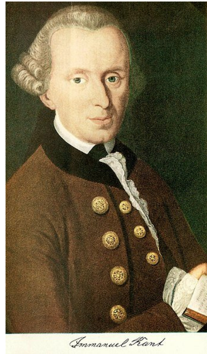
Immanuel Kant sportretowany przez Johanna Gottlieba Beckera

Immanuel Kant (1724-1808), twórca filozofii krytycznej, był osobą na wskroś zdyscyplinowaną, wiodącą nudny i monotony żywot. W jego osobie i dziele najlepiej być może manifestuje się potęga ludzkiego rozumu: wysublimowany świat intelektualnych spekulacji obywa się tu bez zewnętrznych podnieć, skandali i bogatych życiowych doświadczeń. Kant spędził swe życie w jednym mieście, podporządkowując swoją codzienność pracy intelektualnej. Wstawał wcześnie, intensywnie pracował i punktualnie o godzinie 16:00 wychodził na spacer (pracę zegara na ratuszu korygowano ponoć zgodnie z porami jego przechadzek), czytał, pisał, wykladał, zdobywał kolejne stopnie naukowe. To monotonne życie kawalera-uczonego zaowocowało jednak jednym z najważniejszych dokonań w dziejach europejskiej humanistyki.