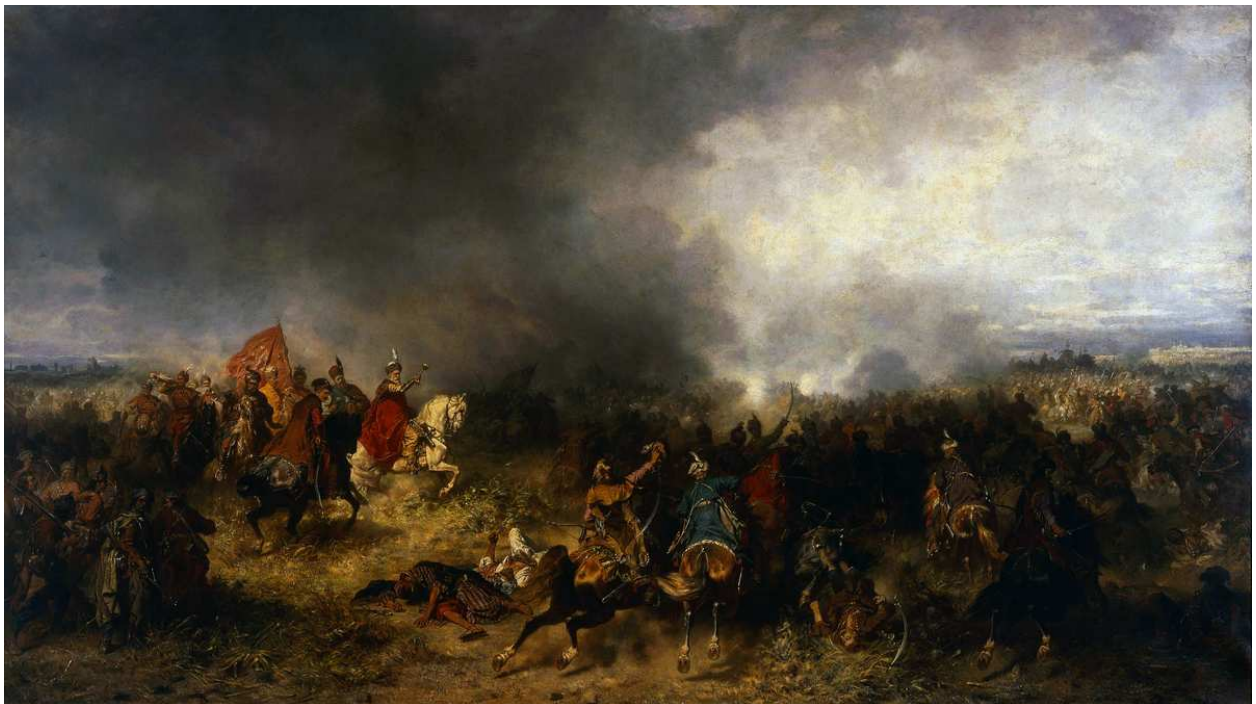
Do najważniejszych należy Transakcja wojny chocimskiej Wacława Potockiego (powst. 1669–1672).

Wiek XVII był stuleciem wojen. Dlatego też etos rycerski, który w epoce renesansu ustąpił ideologii ziemiańskiej (głoszonej między innymi przez Jana Kochanowskiego), odżył w czasach baroku. Chwałę rycerską zaczęto wynosić ponad wszelkie inne zasługi. Żołnierz, „ krew ojczyźnie ofiarując, / gardłem wolność zastępując ” (Stanisław Grochowski, Hołubek ), składał na ołtarzu Rzeczypospolitej największą ofiarę. Widziano w niej także służbę Bogu, tym bardziej, że ówczesna duchowość chętnie odwoływała się do metaforyki militarnej, chcąc opisać walkę chrześcijan z własnym grzechem, słabościami oraz mocami zła. Takie przekonanie utrwaliło się już w pierwszej połowie XVII stulecia (wojny z Turcją, obrona Chocimia w 1621 r.), a zwłaszcza po wojnach lat 1648–1667 (powstanie Chmielnickiego, potop szwedzki, wojny z Moskwą).