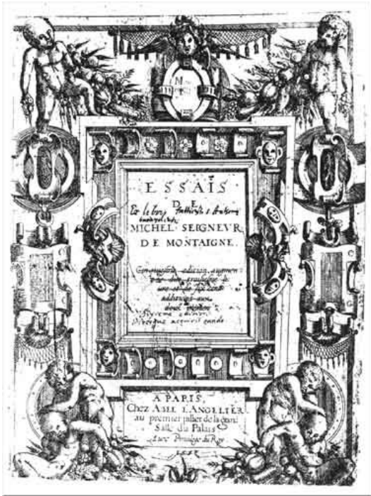
Wydanie Prób Montaigne'a z 1588 roku

Za ojców gatunku uważa się francuskiego pisarza i filozofa renesansu Michela de Montaigne'a , autora Prób , oraz Francisa Bacona , angielskiego filozofa i polityka, choć wcześniejsze formy eseju, nazywane „szkicami”, rozpoznajemy już w starożytności. Szkice tworzyli wówczas m.in. Platon, Seneka Młodszy, Marek Aureliusz i Cynceron. W polskiej literaturze cechy eseju nosiły już teksty twórców doby oświecenia, m.in. Stanisława Staszica, pełniej jednak widać znamiona tego gatunku w tekstach krytycznoliterackich okresu Młodej Polski, m.in. u Stanisława Brzozowskiego czy Stanisława Witkiewicza. W XX-leciu międzywojennym twórczością