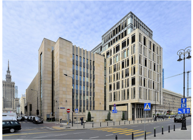
Budynek Naczelnego Sądu Administracyjnego