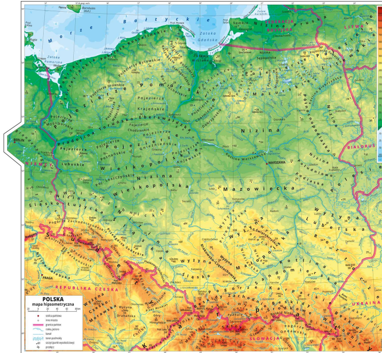
Polska – mapa hipsometryczna

Adresy wybranych stron internetowych dotyczących poszczególnych regionów Polski znajdują się poniżej. Prezentacja nie może jednak wykorzystywać tylko treści znajdujących się na tych stronach – należy użyć również innych źródeł informacji.