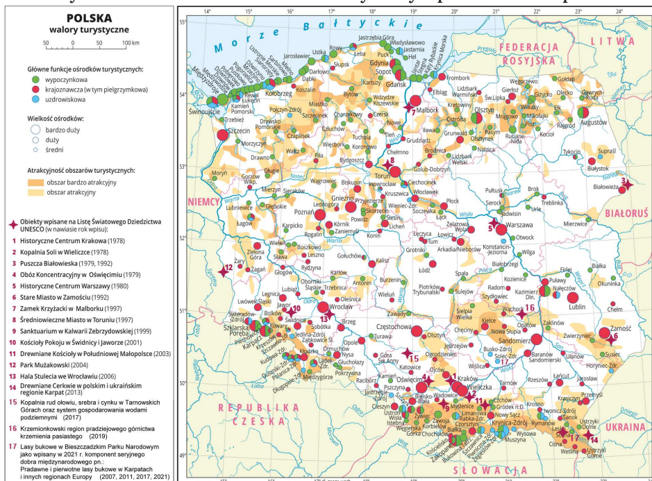
Mapa walorów turystycznych Polski

Wybór regionu turystycznego do prezentacji to kwestia niemal wyłącznie waszego gustu. Najlepiej jest opracowywać prezentację tego regionu, który ciekawi was najbardziej, który chcielibyście poznać bliżej. W e-materiałach Turystyczne walory Polski , Krajobrazy Polski – krajobraz wielkomięjski w Warszawie czy krajobraz nizinny na Nizinie Mazowieckiej – i innych mieliście możliwość zapoznać się z głównymi walorami turystycznymi całej Polski. Oprócz tego macie też swoje własne doświadczenia z wakacyjnych podróży, wycieczek szkolnych lub innych wyjazdów, a także z literatury, filmów, zdjęć czy opisów słownych. A zatem wybór należy do was. Pomocna może w tym być poniższa mapa.