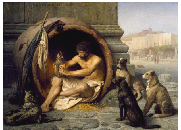
Jean-Léon Gérôme, Diogenes , 1860

Zapytany, gdzie w Grecji widzi się dobrych mężów, odpowiedział: „Dobrych mężów nigdzie, natomiast dobre dzieci w Sparcie”. Gdy raz mówił o rzeczach poważnych, a nikt go nie słuchał, zaczął gwizdać, a gdy się ludzie zgromadzili wokół niego, lajał ich, że na głupi żart zbiegli się skwapliwie, do rzeczy poważnych natomiast ociągali się. Mówił także, że ludzie idą w zawody ze sobą, gdy chodzi o kopanie rowów i ćwiczenie sprawności nóg, ale nikt nie idzie w zawody o to, by stać się doskonałym moralnie. Dziwił się, że gramatycy tak starannie badają błędzenia Odyseusza, własnych natomiast błędów nie widzą, że muzycy zestrzajają struny w lirze,