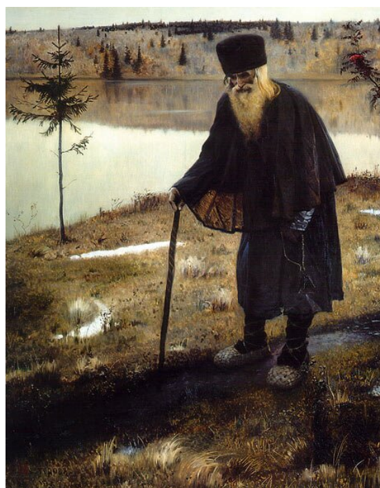
Michail Niestierow, Pustelnik , 1888/1889

Wiele bowiem rzeczy stoi na przeszkodzie, aby można było coś o tym wiedzieć; niemożliwość odpowiedniego doświadczenia zmysłowego i krótkość życia człowieka.