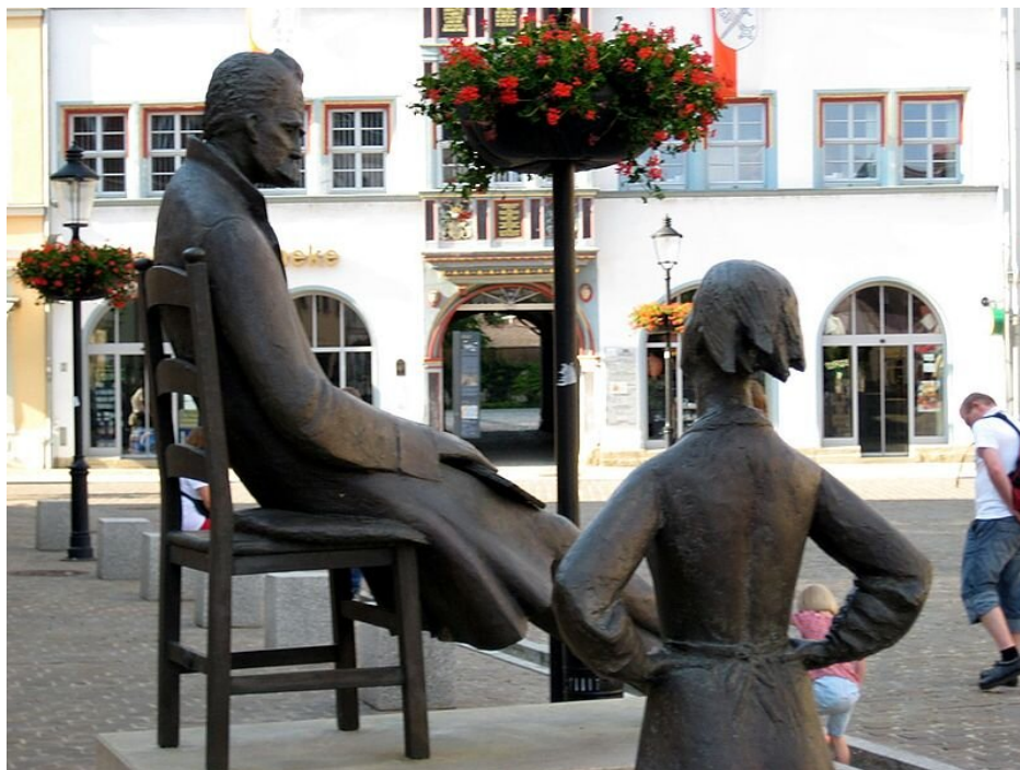
Pomnik Friedricha Nietzschego w Naumburgu (Dolna Saksonia) w Niemczech