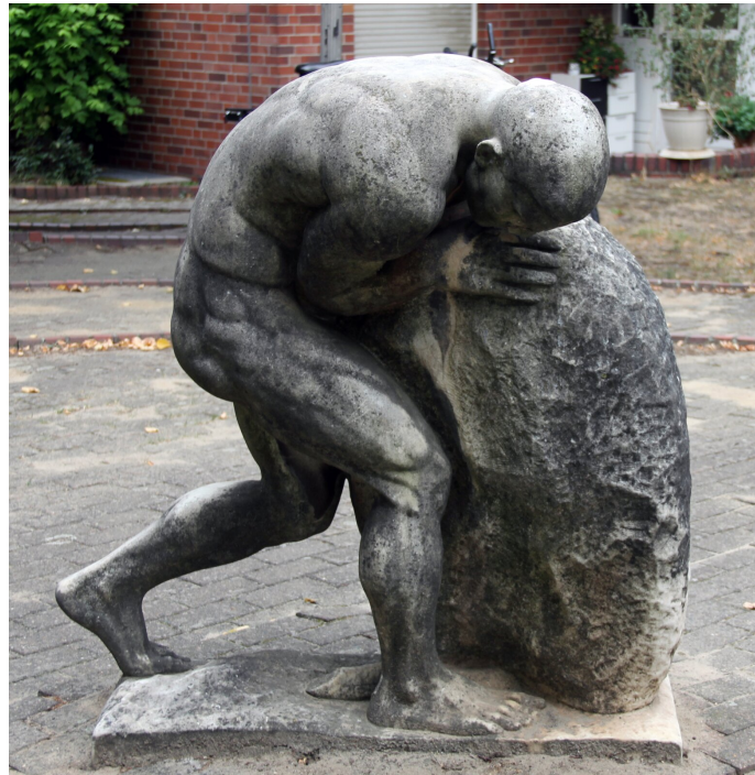
Rzeźba Syzyfa w Berlinie