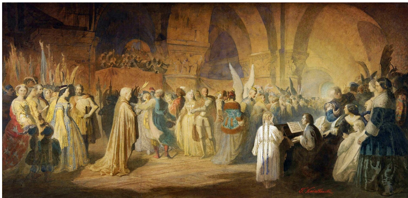
Teofil Kwiatkowski, Bal w Hotelu Lambert , 1859, domena publiczna

Źródło: Sławomir Rzepczyński, Norwid i nowoczesność (perspektywa podmiotowości) , „Colloquia Litteraria”, nr 2007, 2/3, s. 9.