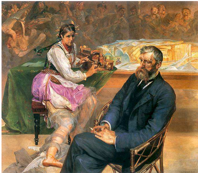
Jacek Malczewski, Portret Adama Asnyka z Muzą , 1894–1897

„Każda epoka ma swe własne cele” – pisał Adam Asnyk w wierszu Do młodych . Poeta wierzył w nieustanny rozwój i podkreślał, że podstawowym prawem istnienia świata jest przemijalność. Mimo że reprezentował pokolenie pozytywistów, szanował dorobek wcześniejszej epoki romantyzmu, nawiązując z nim twórczy, wolny od uprzedzeń dialog o wartościach.