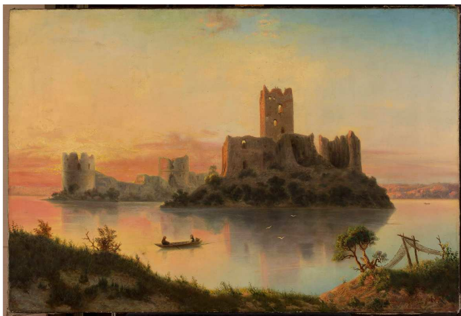
Józef Marszewski, Ruiny zamku w Trokach o zachodzie słońca , 1866