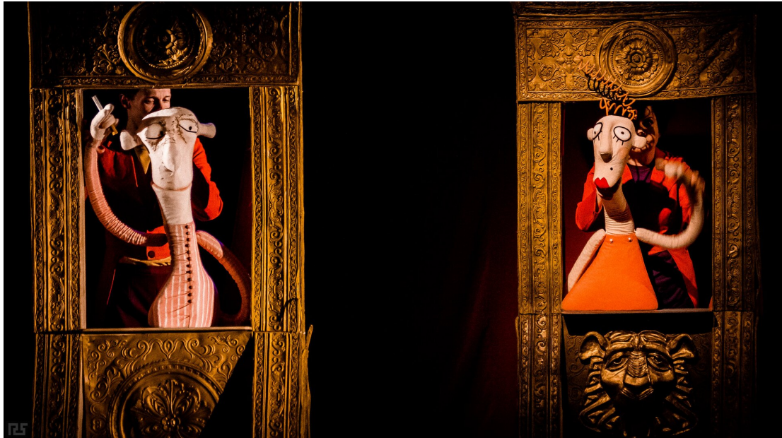
Spektakl lalkowy Świątoszek wystawiony w ramach międzynarodowego forum "teART" 2015 w Mińsku

Ostatnie sceny aktu IV przypominają budowę tragedię: komizm łączy się tu z tragizmem (złamanie reguły stosowności). Pojawia się też rekwizyt jako czynnik mający znaczący wpływ na rozwój wypadków (złamanie reguły prawdopodobieństwa).