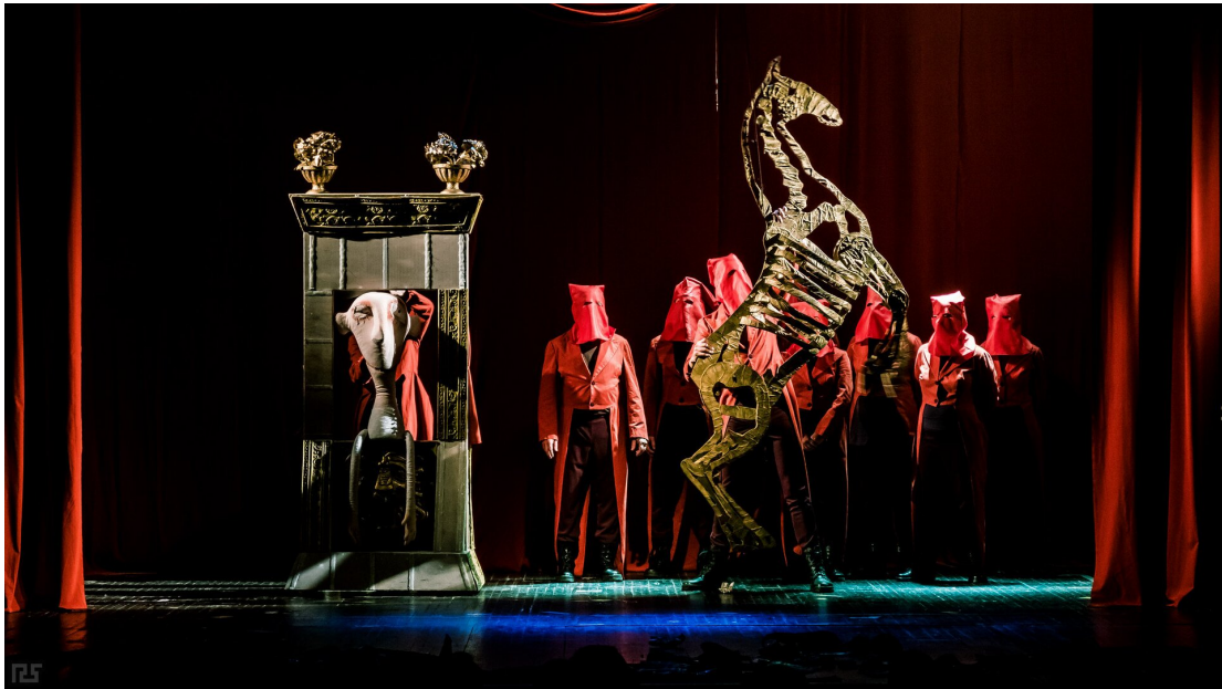
Spektakl lalkowy Świętoszek wystawiony w ramach międzynarodowego forum "teART" 2015 w Mińsku