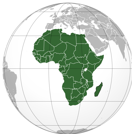
Kraje członkowskie Unii Afrykańskiej

Od czasu sformułowania Karty Jedności Afryki w 1963 r. do powstania i wejścia w życie Aktu Konstytucyjnego Unii Afrykańskiej wzrosło znaczenie praw człowieka na tym kontynencie. Akt konstytucyjny wśród celów Unii Afrykańskiej wymienia uwzględnienie zasad Powszechnej Deklaracji Praw Człowieka ONZ oraz ochronę praw człowieka i ludów Afryki. Podstawowym dokumentem określającym zasady i zakres ochrony praw jest Afrykańska Karta Praw Człowieka i Ludów z 1981 r. (weszła w życie w 1986 r.). Kładzie ona nacisk na zasady solidaryzmu społecznego i podmiotem praw