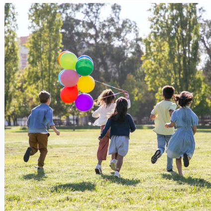
System ochrony praw człowieka w ramach Rady Europy