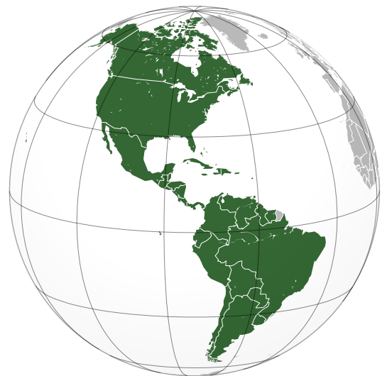
Kraje członkowskie OPA

Ochrona wolności i praw człowieka w Ameryce opiera się na regionalnych dokumentach, przede wszystkim zaś na Karcie Organizacji Państw Amerykańskich (OPA) z 1948 r. i Powszechnej Deklaracji Praw i Obowiązków Człowieka (z grudnia 1948 r.). Przyjęła kształt Amerykańskiej Konwencji Praw Człowieka (tzw. Pakt San Jose z 1969 r., który wszedł w życie w 1978 r.), do której w 1988 r. dołączono Protokół dodatkowy dotyczący praw gospodarczych, społecznych i kulturalnych (nietworzących zobowiązań prawnomiędzynarodowych).