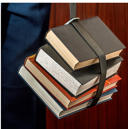
Współczesne systemy ochrony praw człowieka. Ochrona praw człowieka w ramach Unii Europejskiej