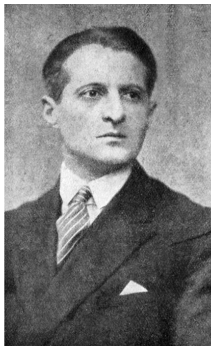
Julian Tuwim ok. 1930

Utwór Tuwima Sokrates tańczący , pochodzący z tomu o tym samym tytule, wydanego w 1920 roku, odznacza się cechami typowymi dla poezji skamandryckiej . Przede wszystkim uwagę zwraca widoczny w wierszu witalizm , czyli radość z życia w najbardziej zwyczajnych jego przejawach, takich jak taniec, słuchanie muzyki czy wygrzewanie się w słońcu. Z tym łączy się optymizm, w tej sytuacji lirycznej tożsamy z afirmacją życia poprzez taniec. Istotnym wpływem jest także dionizyjskość , czyli wyrażenie zachwytu życiem w tańcu i poprzez upojenie alkoholem.