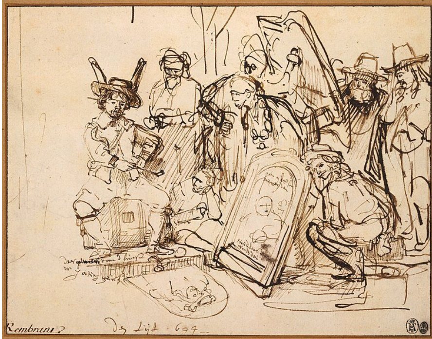
Rembrandt van Rijn, Satyra na krytykę sztuki , 1644