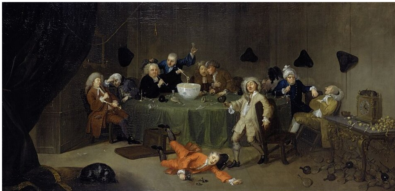
William Hogarth, Rozmowa o północy , ok. 1732