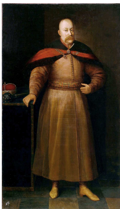
Daniel Schultz, Portret Janusza Radziwiłła , 1652–1654

Od tego momentu Radziwiłł musiał toczyć bratobójcze walki z wieloma wielkimi polskimi rodami szlacheckimi (m.in. z Sapiehami). Pokonany w licznych potyczkach, ograbiony z majątku i uzależniony od wątpliwej szwedzkiej pomocy zmarł w nocy z 30 na 31 grudnia 1655 r. podczas przygotowań do obrony Tykocina przed armią Jana Kazimierza. Został prawdopodobnie otruty.