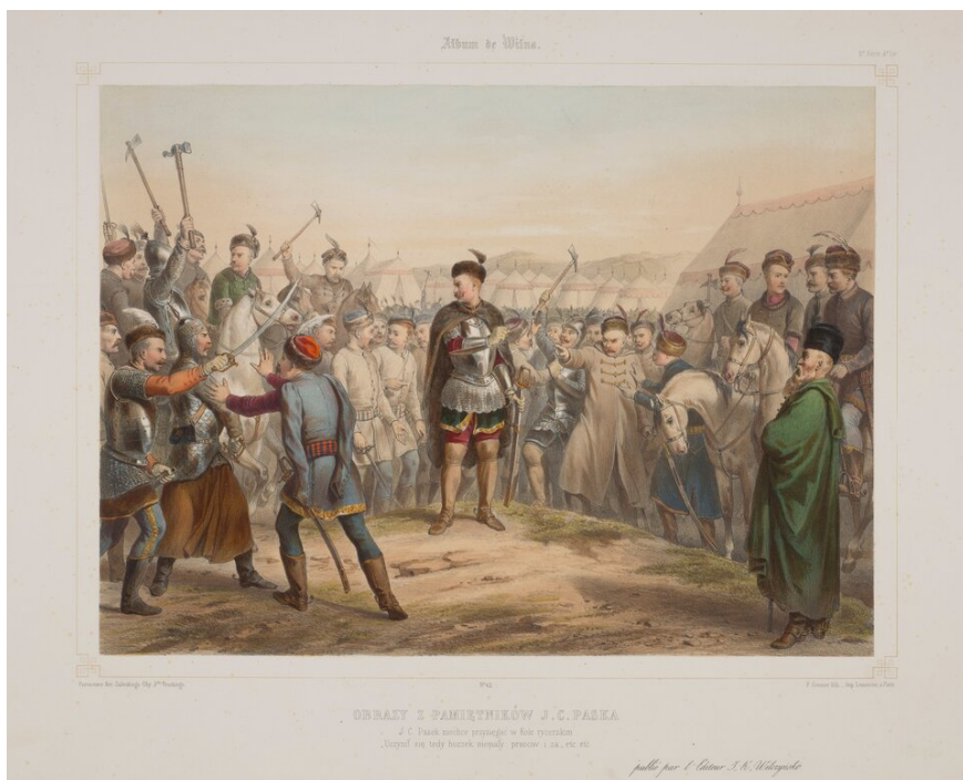
Ilustracja do Pamiętników Paska