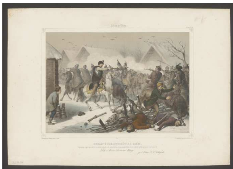
Antoni Zaleski, Ilustracja do Pamiętników Jana Chryzostoma Paska, 1850