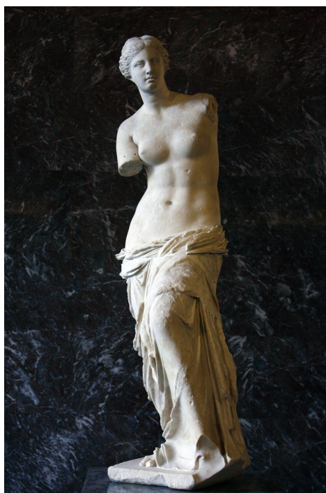
Wenus z Milo

Wyszukaj fragmenty powieści, w których Tomasz Judym obserwuje dzieła sztuki (np. rzeźbę Wenus z Milo lub obraz Ubogi rybak ). Zastanów się nad poziomem wrażliwości bohatera i jego odbiorem dzieła artystycznego. Zredaguj na ten temat kilkuzdaniową notatkę.