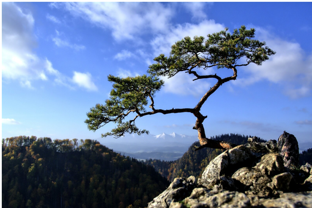
Sosna na skale