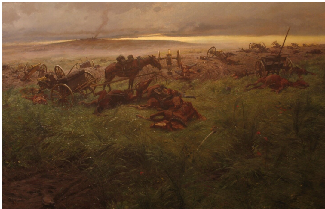
Rudolf Otto Ritter von Ottenfeld, Karta chwały austriackiej artylerii

Źródło: 1897, olej na płótnie, Heeresgeschichtliches Museum, domena publiczna.