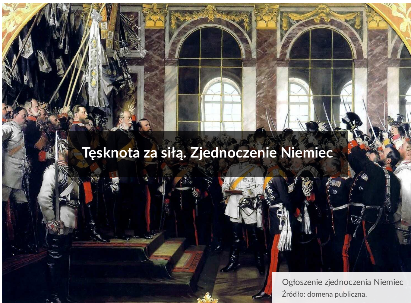
Ogłoszenie zjednoczenia Niemiec

W 2. połowie XIX wieku Prusy, zmieniając układ sił w Europie, rozpoczęły drogę do zdominowania sytuacji politycznej i militarnej na kontynencie europejskim.