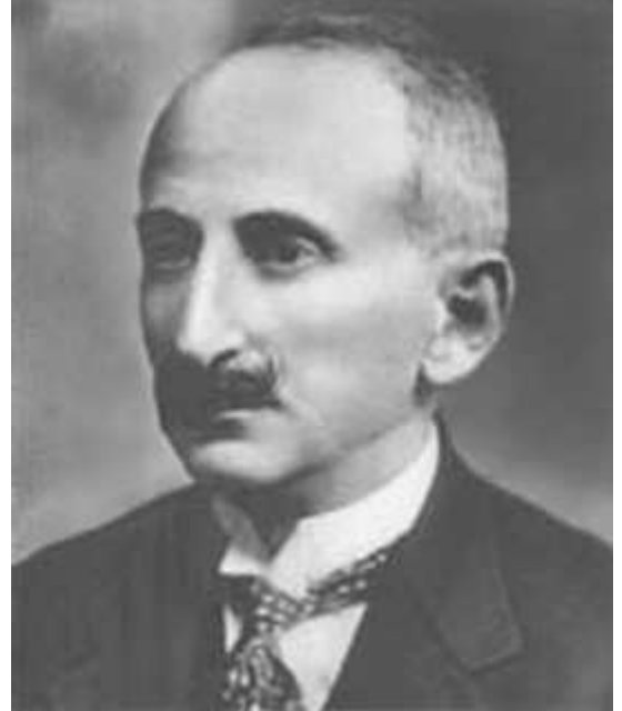
Bolesław Leśmian (1877-1937)